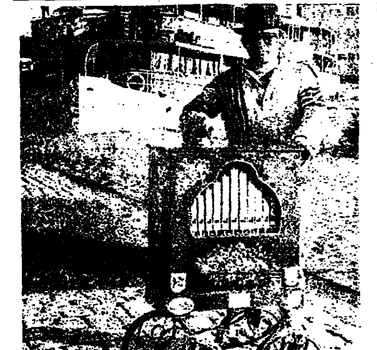
رقم قياسي على الأورغن

صابت مدينة رسول الله صلى الله عليه وسلم ، على عهد عمر بن الخطاب رضي الله عنه ، حزة طيبة .. فنجح الناس وظهيم مقروعا . وبين لهم انهم احدثوا فخريا فكان هذا عقابهم . وانهم غيروا ما باتسهم من خير ونور ، فغير الله نعمته عليهم .. ثم التمس : لمن عدتم ، وحدثت حزة اخرى ، لاخرن من بين ظهرايتكم ، ولا اسلكتم في ارض ابدا ! ترى .. ألم تكن لمة المدينة مظاهر جيولوجية ، كما لاية حزة اخرى ؟ بل ، لكن « المظهر » شبه ، و « السبب » شبه اخر ، المظهر هو الكيفية المحسوسة في عالم الشهادة ، للسبب غير المحسوس ، كما هو في عالم الغيب ، لذلك راي عمر رضي الله عنه في الزلازل مظهرا لانحراف اسطح قصب الله عز وجل ، ولم يتوقف عند هذا المظهر ، ولم يحجب به ، ولم يوهل اليه .. ولكنه نطق منه بسرعة وسداد الى السبب ، فدعا الناس الى